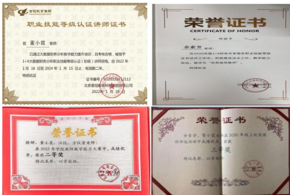
图4 教师积极提升综合专业技能

教师积极参加线上线下专业技能培训和各级比赛,同时还指导指导学生参加各级比赛,并取得了一定的成绩。