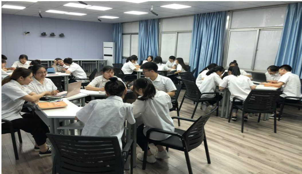
图2 分组扮演不同岗位角色

(4) 课中：老师针对每个小组存在的共性问题进一步总结、归纳，并提出好的解决方法