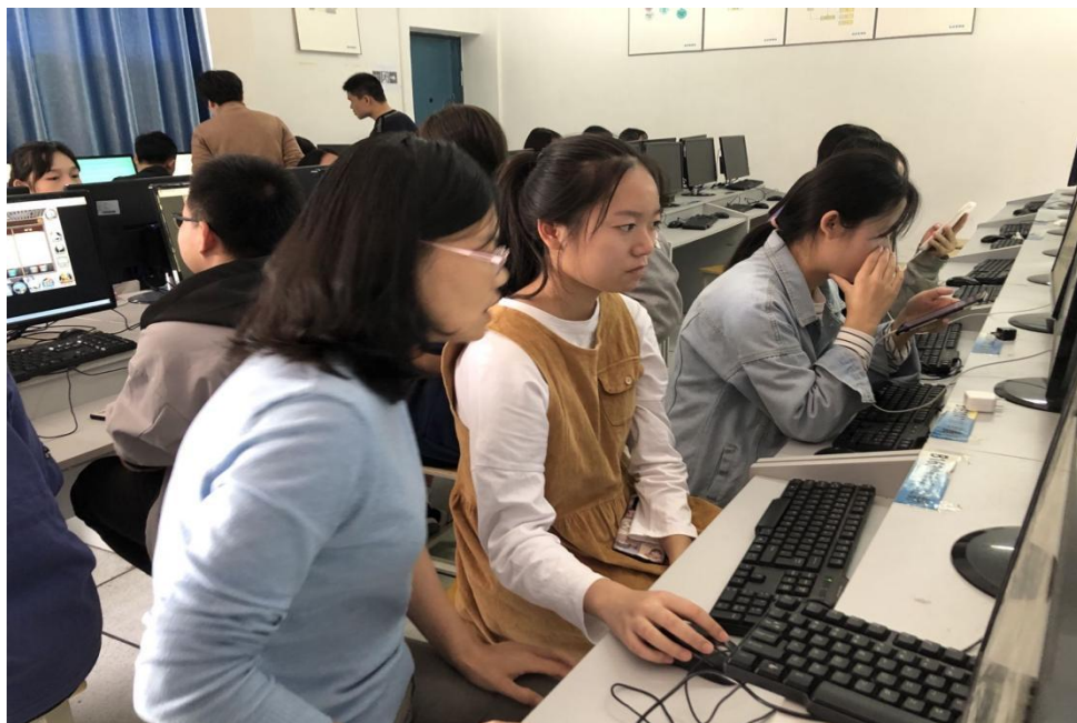
图3 老师分组指导，差异化教学

(4) 课中：老师针对每个小组存在的共性问题进一步总结、归纳，并提出好的解决方法