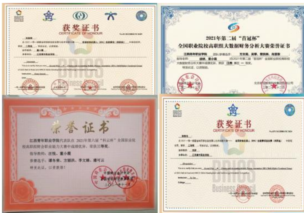
图5 学生实操技能有长进