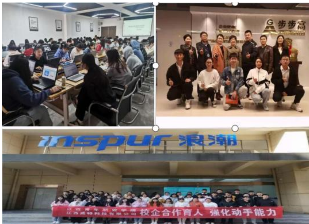
图6 学生在企业沉浸式岗位实操练习